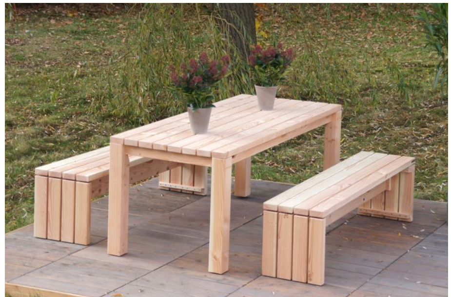
Gartenmöbel Set - kombinierbar mit Tisch 1 - 3