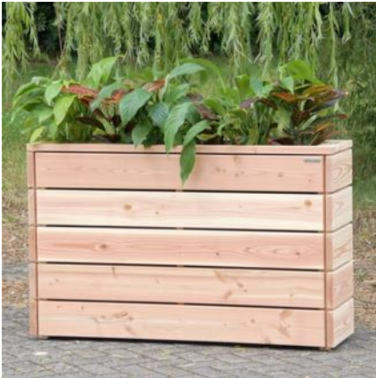
Pflanzkasten Lang S, Natur