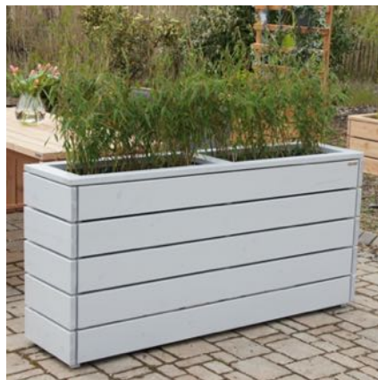
Pflanzkasten Lang L, Lichtgrau