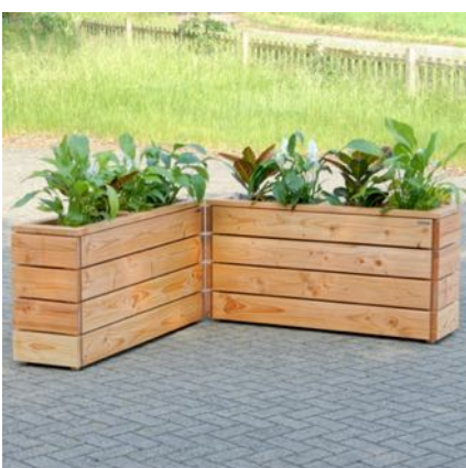
Pflanzkästen Lang S, Natur