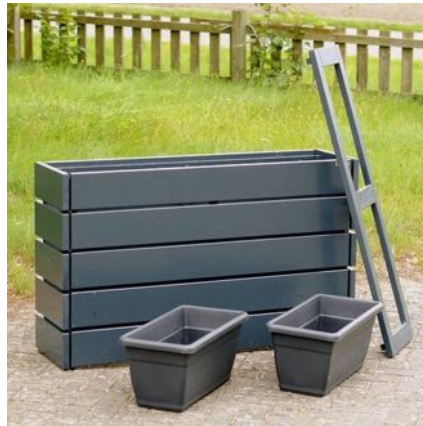
Pflanzkasten Lang M, Anthrazit