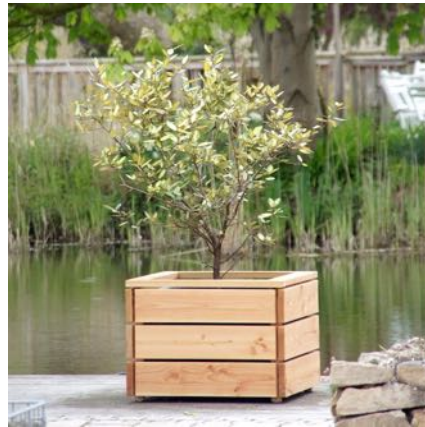
Pflanzkübel L, Natur