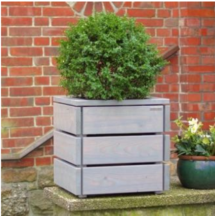
Pflanzkübel M, Grau