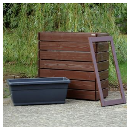
Pflanzkasten L, Dunkelbraun