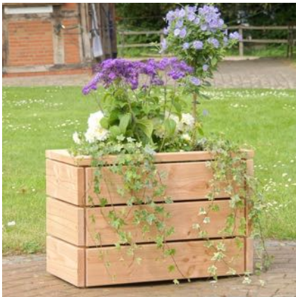
Pflanzkasten S, Natur