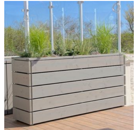
Pflanzkasten Lang M, Grau