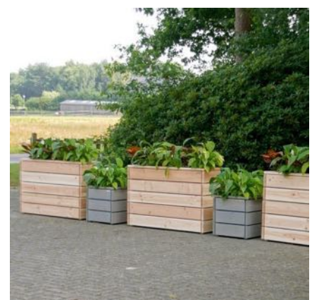
Pflanzskästen Lang S, Natur