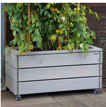
Pflanzkasten L, Grau