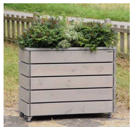
Pflanzkasten L, Grau