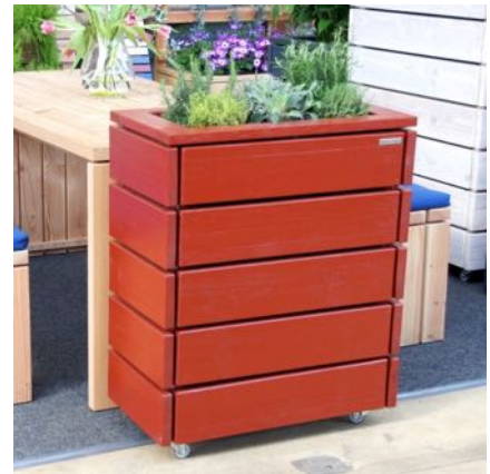
Pflanzkasten S, Nordisch Rot