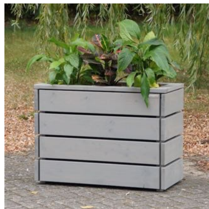
Pflanzkasten M, Grau