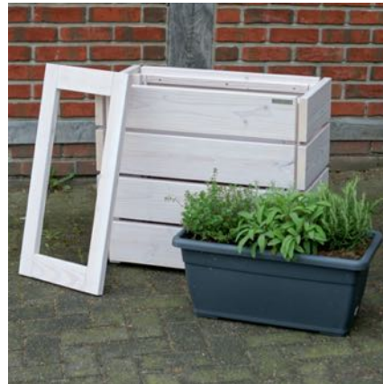
Pflanzkasten S, Weiß