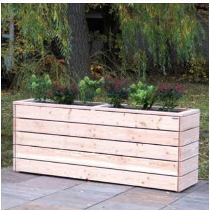
Pflanzkasten Lang L, Natur