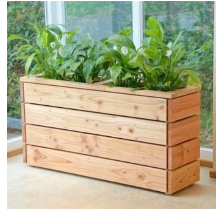
Pflanzkasten Lang S, Natur