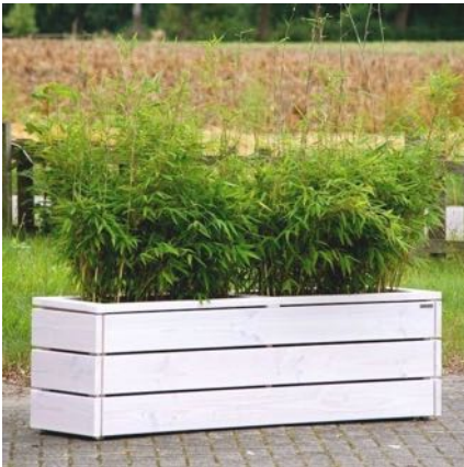
Pflanzkasten Lang M, Weiß