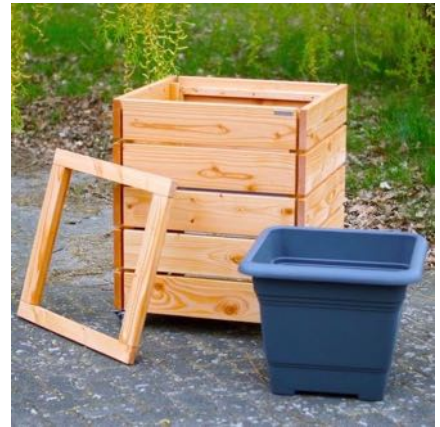
Pflanzkübel L, Natur Geölt