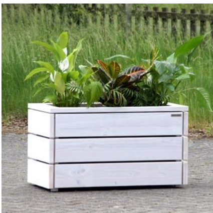
Pflanzkasten M, Weiß