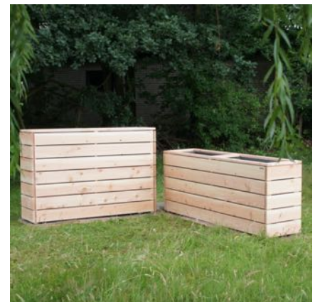
Pflanzkasten Lang L, Natur