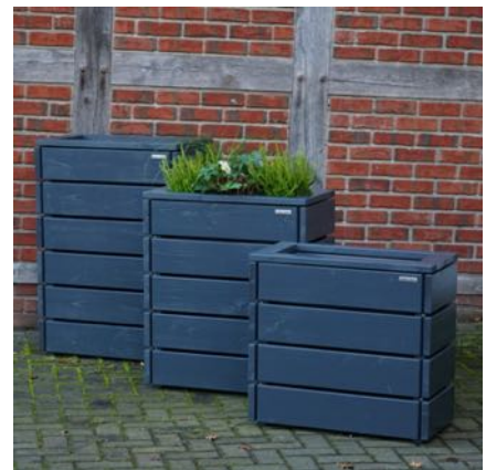
Pflanzkasten M, Anthrazit