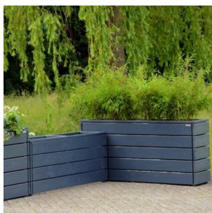
Pflanzkästen Lang M, Anthrazit