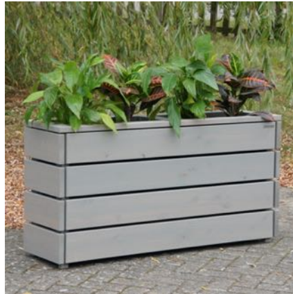
Pflanzkasten Lang S, Grau