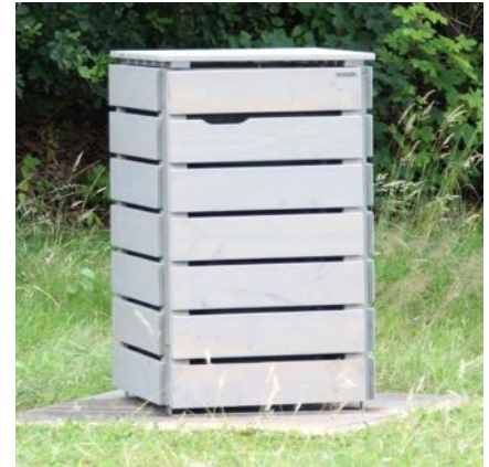
Oberfläche: Transparent Grau