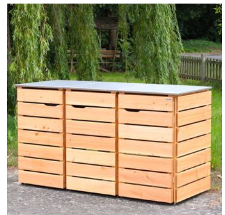
Oberfläche: Natur Geölt