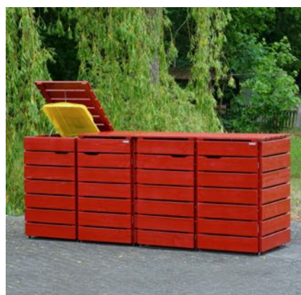
Oberfläche: Nordisch Rot