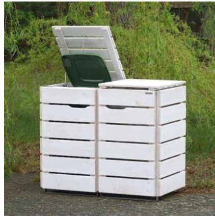
Oberfläche: Transparent Weiß