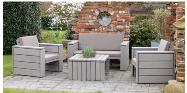
Loungemöbel Set 2