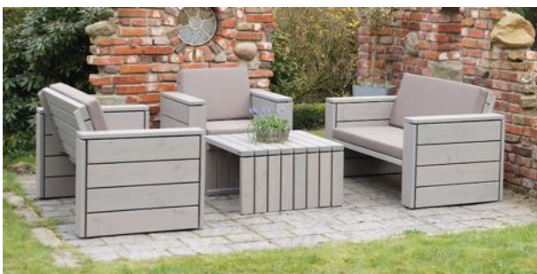
Loungemöbel Set 3