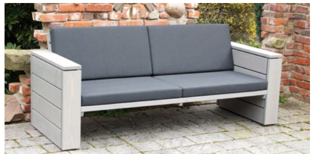
Lounge Sofa 3-4 Sitzler