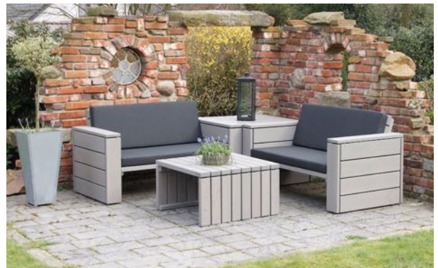
Loungemöbel Set 8