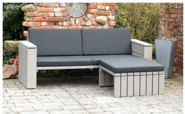
Loungesofa mit Hocker