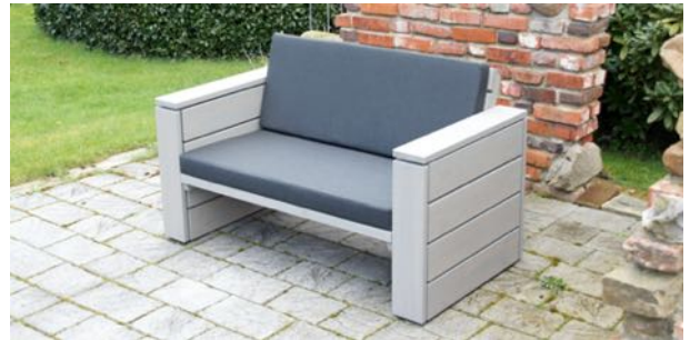
Lounge Sessel XL