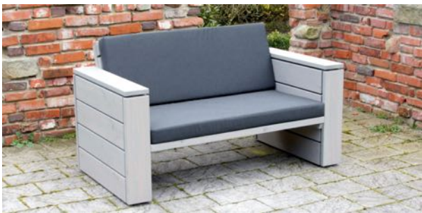
Lounge Sofa 2 Sitzler