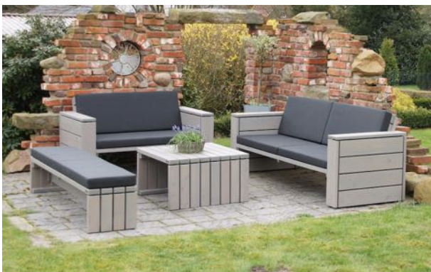
Loungemöbel Set 5