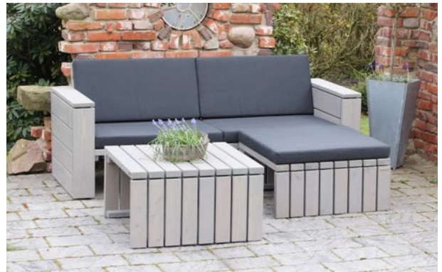
Loungemöbel Set 6