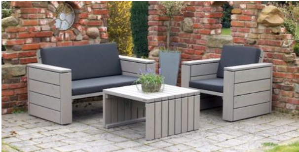
Loungemöbel Set 1