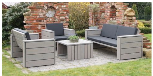
Loungemöbel Set 4