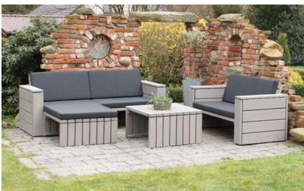
Loungemöbel Set 7