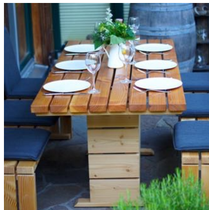
Gartenmöbel Set 2