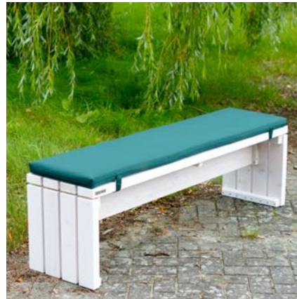
Gartenbank mit Polster