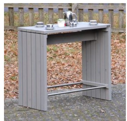
Stehtisch / Bartisch