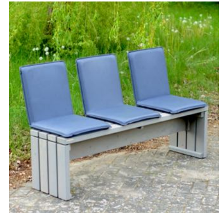
Gartenbank mit Sitzschalen