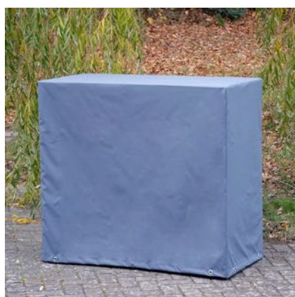
Möbelhaube für Stehtisch