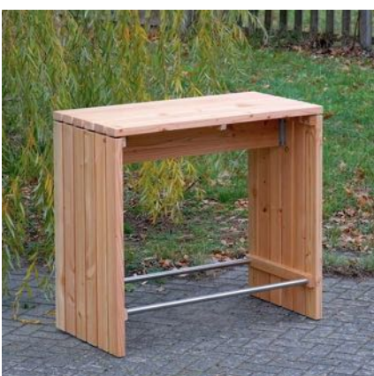
Stehtisch / Bartisch