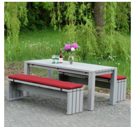
Gartenmöbel Set 3