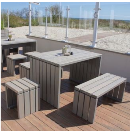
Gartenmöbel Set 1